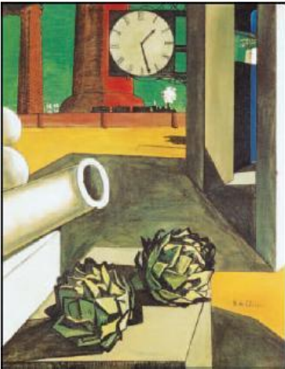
Τζιόρτζιο ντε Κίρικο, Η κατάκτηση του φιλοσόφου , 1914, Σικάγο, Ινστιτούτο Τέχνης.

Όλοι μας θεωρούμε ότι η αλήθεια είναι κάτι πολύ σημαντικό. Απαιτούμε από τους πολιτικούς να μας λένε την αλήθεια. Ο δικαστής πρέπει να αναζητήσει και να αποκαλύψει την αλήθεια, για να μπορέσει να δικάσει σωστά. Εκτιμούμε αυτούς που λένε την αλήθεια και περιφρονούμε τους ψεύτες. Θεωρούμε ότι η επιστήμη ψάχνει να ανακαλύψει την αλήθεια για το πώς είναι ο κόσμος. Στην καθημερινή ζωή όλοι, λίγο ή πολύ, καταλαβαίνουμε τι είναι η αλήθεια. Ακόμα και ένα μικρό παιδί θα καταλάβει αμέσως, αν του πούμε: "Πες μου την αλήθεια, εσύ έσπασες το βάζο." Όταν όμως προσπαθήσουμε πιο συστηματικά να δούμε τι είναι αυτό που κάνει κάτι αληθές, τι κριτήρια έχουμε, για να κρίνουμε πότε κάτι είναι αληθές, ή ποια είναι η σχέση των πεποιθήσεών μας με την πραγματικότητα, για να είναι αληθείς και να αποτελούν γνώση, τότε τα πράγματα γίνονται πιο πολύπλοκα.