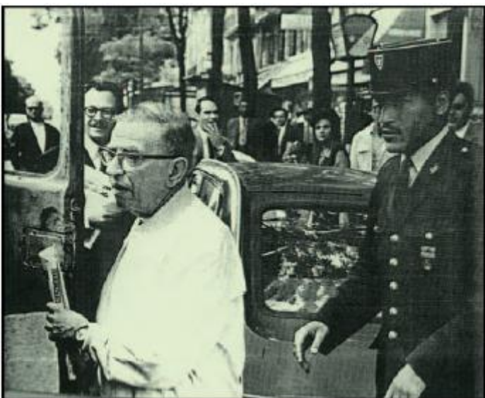
Στη φωτογραφία ο φιλόσοφος Ζαν- Πολ Σαρτρ παρακολουθείται στενά, όπως συνέβαινε συχνά, από έναν εκπρόσωπο των γαλλικών δυνάμεων ασφαλείας.